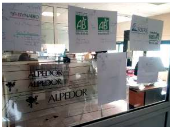
Atelier d'animation autour d'un nouveau nom