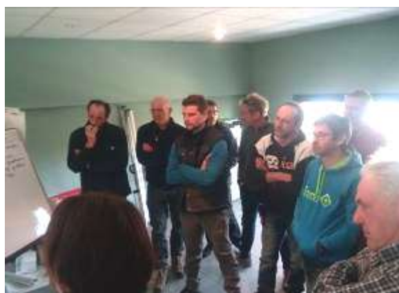
Atelier d'animation autour d'un nouveau nom