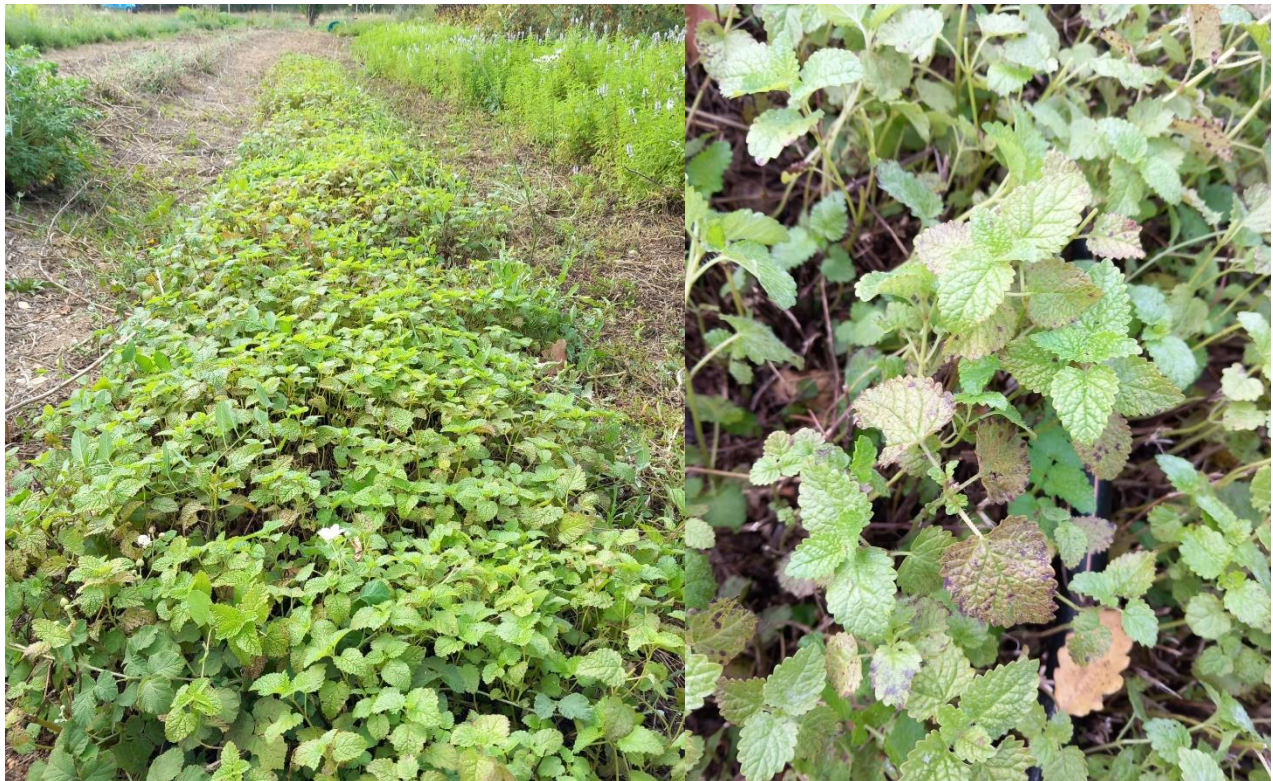
Mélisse, plantée en double-rang : symptômes de septoriose (13 septembre)

Infos sur la septoriose de la mélisse : cliquer ici .