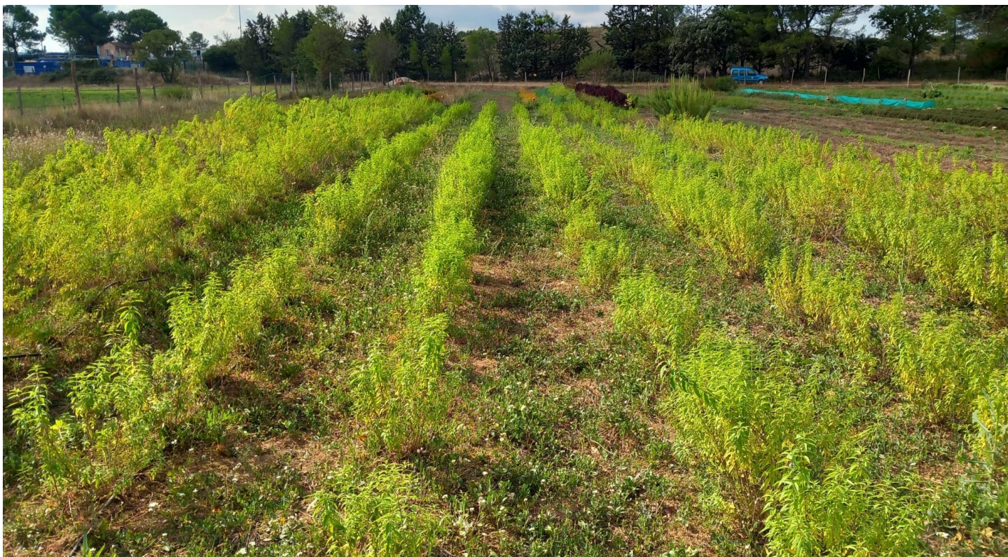
Verveine odorante – frais et herboristerie – plantée en 2021 (13 septembre)

Première coupe début juillet. Prochaine coupe à venir d'ici 1 semaine. Le producteur va prochainement bouturer sur les plants pas coupés de l'année (à gauche sur la photo).