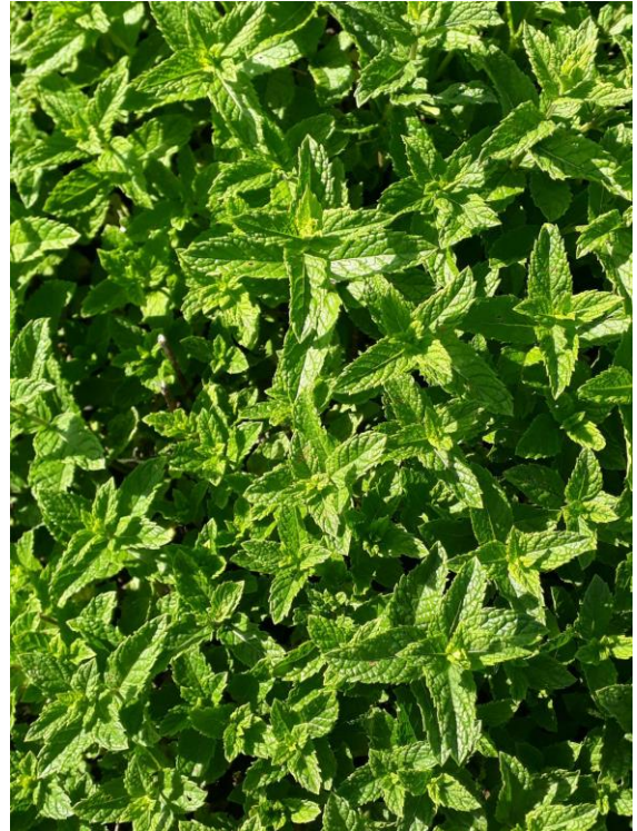
Comparaison entre la menthe poivrée et la menthe douce