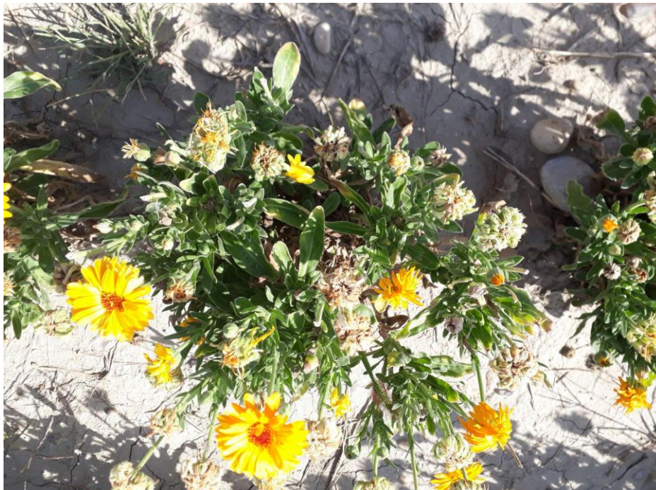
Calendula - planté en 2023 : Boutons avortés (5 septembre)

Le calendula continue à être récolté même s'il est en fin de cycle et que les fleurs sont moins jolies. L'oïdium n'est pas présent sur la culture. En revanche, comme le mois précédent, certains boutons semblent avoir avorté. Cette problématique pourrait également être liée à un stress thermique, qui bloquerait les montées de sève. Bien arroser peut pallier partiellement au problème et attendre la baisse des températures.