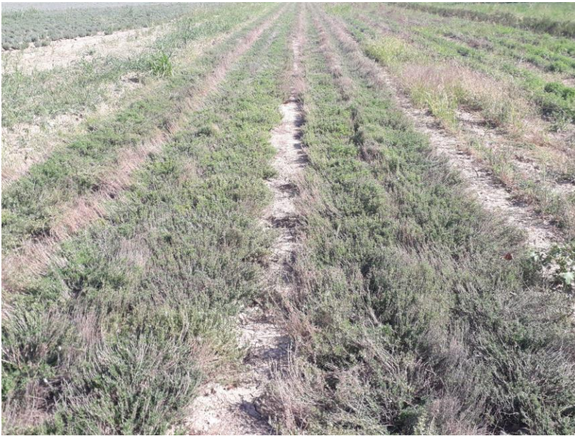
Redémarrage des sarriettes (5 septembre)