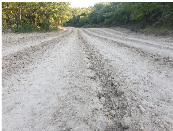
Figure 1: Plantation de menthe de l'année avec des difficultés de reprise

84 – Luberon : Les plantations de printemps (avril) de l'année au sec ont de réelles difficultés pour la reprise, d'autant plus celles qui ont été faites dans un sol argileux, qui se rétracte, fait des fentes de retrait et les mini-mottes remontent. Pour ce type de sol, il semble essentiel de pailler après la plantation pour garder l'humidité le plus longtemps possible, d'envisager l'irrigation au moins pour l'installation des cultures et de faire un travail, dans un temps plus long, pour remonter le taux de matière organique du sol (mise en place d'intercultures, apport de matière organique, intégration de cultures laissant des résidus...).