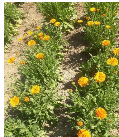
Figure 3: Calendula à floraison

05 – Gapençais : En pleine récolte, qui est prévue jusque mi-septembre. Mais rencontre un problème de chenilles dans les sommités fleuries qui sont toutes petites à la floraison (trou dans la capitule), mais qui sortent du cœur des capitules pendant le séchage : il s’agit d’une chenille de noctuelle, Helicoverpa armigera (aussi appelé « chenille de la tomate » !), qui est très phytophage. Solutions possibles en bio : toiles insect-proof ou voile, détruire les résidus de culture, auxiliaires ( Macrolophus pygmaeus , Steinernema carpocapsae , Trichogramma sp) ou Bacillus thuringiensis (plus d’infos