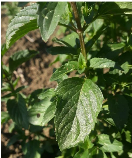
Figure 7: Menthe avec piqûres de cicadelles

84 – Albion (Sault) : Les plantations de l'année se développent bien. Des petites tâches blanches (qui vont parfois jusqu'à se nécroser) sont présentes sur les feuilles, probablement liées à des piqûres de cicadelles.