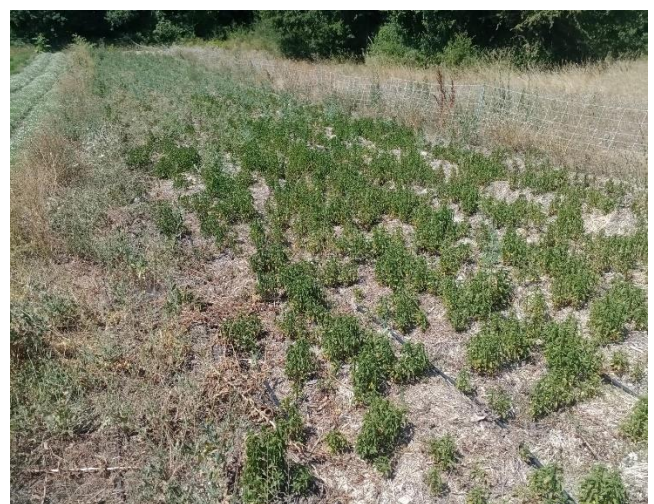
Figure 8: Menthe du Buëch le 21/07/2022 (irrigation abandonnée depuis quelques semaines)

Rédaction : Mégane VECHAMBRE – Agribio04, Victor GALLAND – Agribio05, Sarah PARENT – Chambre d'Agriculture 04