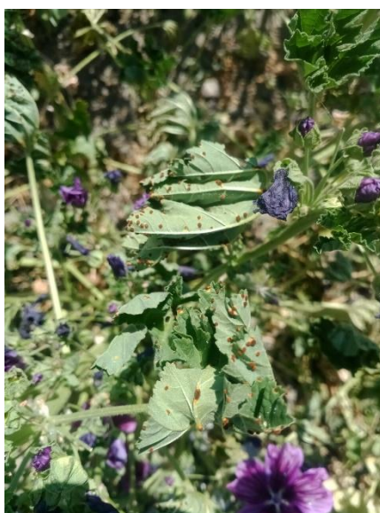
Figure 5 : Mauve avec des symptômes de rouille

05 – Buëch : Récolte en cours de plants beaucoup plus petits que d'habitude