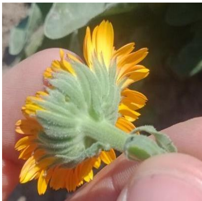
Figure 4: Calendula avec une perforation sur le sépale

04 – Albion (Banon) : Le semis de calendula continue à bien se développer grâce toujours à l’irrigation tous les 2 jours. La floraison n’est pas encore là.