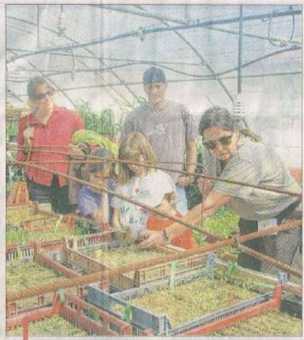
Il y avait beaucoup à apprendre pour les visiteurs de Graines de Soleil lors de la journée "De ferme en ferme".